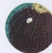
Sphaerechinus granularis 6 cm