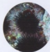
Paracentrotus lividus 5 cm