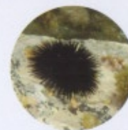
Arbacia lixula 5 cm